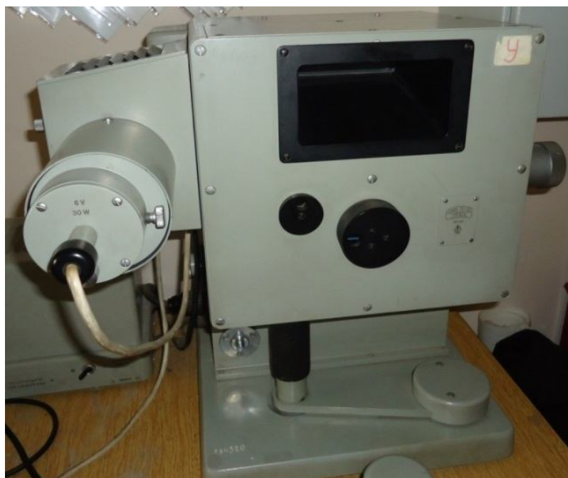
Рис. 1. Лейкометр с переменным осветителем, блоком питания и дросселем

Принципиальная схема прибора показана на рис. 2.